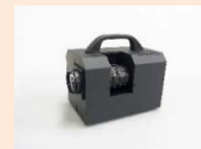
Dr.SPECKLE (スペックルコントラスト測定装置)

当社（株式会社オキサイド）久保田研究所及び先端レーザ&光学技術チーム(ALOT)では、これまで培ってきた光学材料及びレーザー等フォトンクス技術を更に磨き上げ、それらを駆使し技術コンサルティングや計測機器を顧客ニーズに沿って提供しております。想定顧客は、車載関連分野で、この市場で、エコ、安全、安心、快適なドライバー空間を実現するための先端計測機器及び光学デバイスの提供を目指しております。